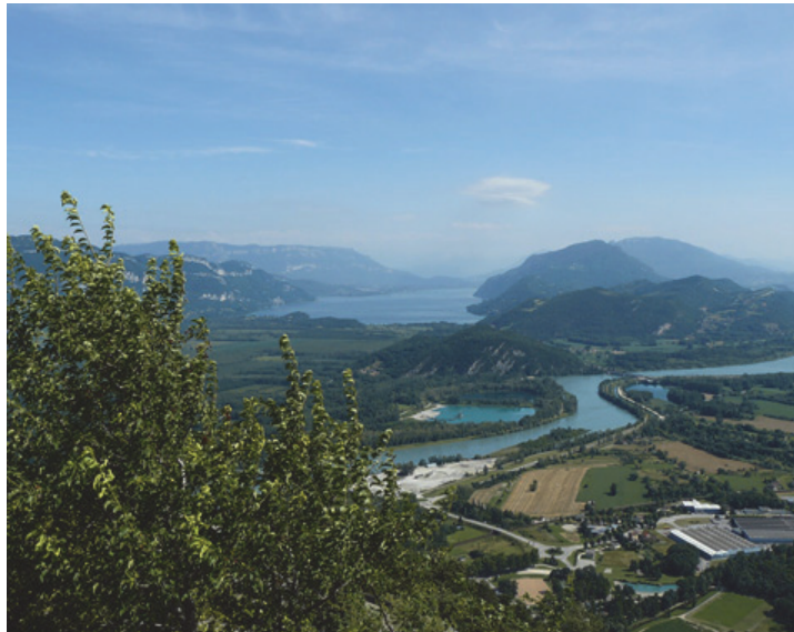
Vue sur le Rhône et le lac du Bourget du Grand Colombier

Le site comprend le corridor rhodanien, de Genève à Arles, et représente un linéaire de 512 km. Les travaux menés sur ce site atelier intègrent l'ensemble des compartiments de l'hydrosystème : chenal naturel ou court-circuités, retenue d'ouvrage et canaux, marges alluviales et zones humides.