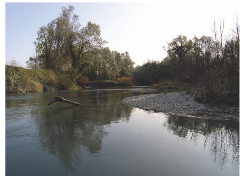
Rhône court circuité de Brégnier-Cordon

Le Programme de Suivi RHEF aborde la question des effets de la restauration (1) des débits réservés dans les chenaux court-circuités par les aménagements hydroélectriques et (2) des connexions des zones humides riveraines avec la nappe phréatique et le chenal du fleuve. Ces suivis se développent depuis de nombreuses années et constituent donc de véritables expérimentations écologiques à grande échelle . Les questions scientifiques concernent aussi bien l'analyse des relations « organismes-habitats » dans le cadre de la mise en œuvre de procédures de restauration, que les enjeux socio-économiques de la restauration fluviale. Il nécessite la mise en commun de compétences en géographie, en géomorphologie, en écologie fluviale, en socio-ethnologie et en modélisation.