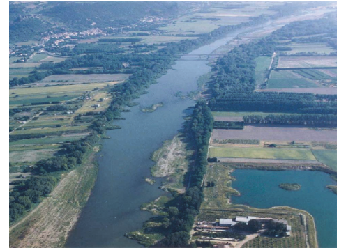
Vieux-Rhône de Montélimar

L'OSR a pour vocation d'étudier les flux sédimentaires et de contaminants associés. En lien avec la société, il cherche à comprendre comment les aménagements, retenues et barrages, enrochements et digues, (« systèmes techniques et sociaux ») modifient la production, le transit et les dépôts de la charge sédimentaire. Les actions programmées dans le cadre de l'OSR ont débutées en septembre 2009.