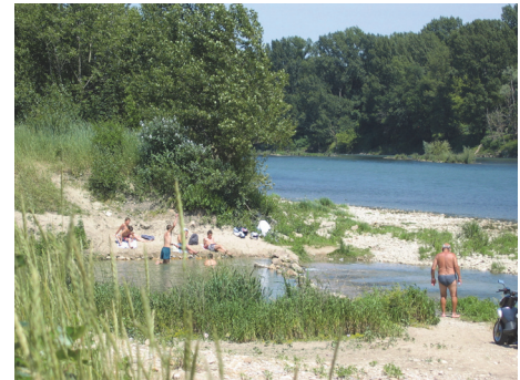
Lône de Vernaison @ Graie

La ZABR avait initialement inscrit l'approche SHS du fleuve au sein d'un thème intitulé «Veille Sociale Rhodanienne». De l'évaluation de ce thème et des discussions conduites avec ses partenaires est ressortie la nécessité pour la Zone Atelier de se situer dans une nouvelle perspective : celle du développement d'un programme propre, permettant de comprendre l'ensemble des relations que la société entretient avec le fleuve ainsi que leurs processus d'évolution. Le dispositif d'«observation sociale du fleuve» mis en place depuis 2006 vise à 1/ définir et produire les données nécessaires à la compréhension des phénomènes en cours et 2/ élaborer le cadre conceptuel et la méthodologie de l'approche du fleuve en tant qu'anthroposystème.